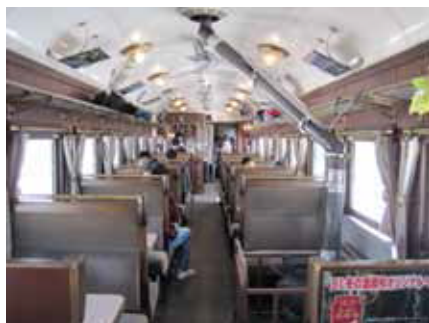
▲2号車カフェカー (車内販売カウンター)