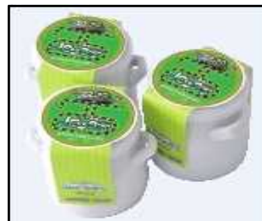
(25周年記念ラベルノロッコ号プリン) 1個：370円