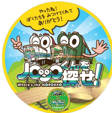
(かくれノロッコくん)