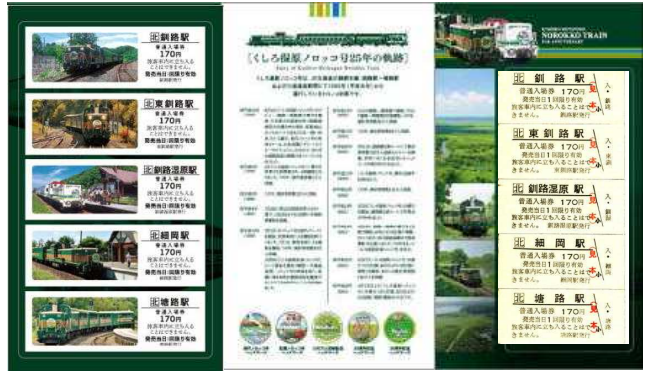
(記念入場券台紙 中面)