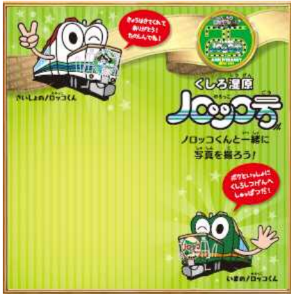
(3番ホーム中央記念撮影パネル)

くしろ湿原ノロッコ号ご乗車のお客様限定で釧路駅内に隠れている「ノロッコくん」を見つけたら写真を撮って、ノロッコ号3号車 販売カウンター係員に見せるとオリジナルステッカーがもらえます！