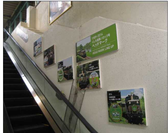
(釧路駅3番ホームエスカレーターパネル)