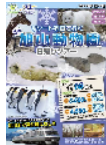
(パンフレットイメージ)

リゾート列車往復 + バス往復 + 旭山動物園入園料※ がセットに！ ※小・中学生の旭山動物園入園料はかかりません。