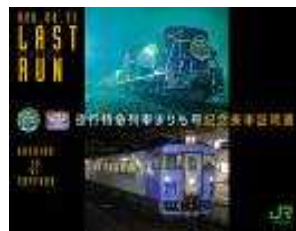
釧路駅発証明書デザイン(イメージ)